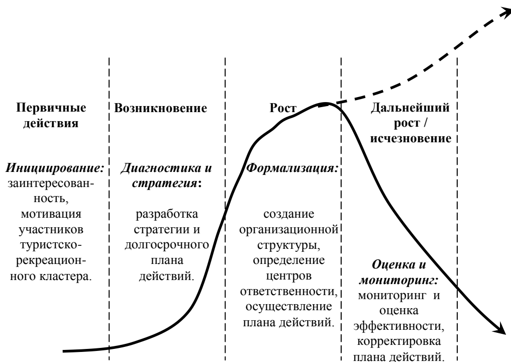
Рис. 2. Жизненный цикл туристско-рекреационного кластера [5, с. 19]

Как отмечается в Руководстве по развитию кластеров и интернационализации предприятий, эффективное функционирование кластера достигается только при наличии высокой заинтересованности со стороны всех его участников. На этапе диагностики в жизненном цикле кластера (рис. 2) определяется его тип и специализация. Объектом данной статьи являются процессы управления предприятиями, обслуживающими сферу горнолыжного туризма и рекреации. Объединение данных предприятий в туристско-рекреационный кластер определяется участниками кластера, осуществляющими разные функции, которые связаны одним процессом – формированием туристического продукта горнолыжного туризма и рекреации посредством собственных ресурсов, а также ресурсов предприятий смежных и сопутствующих отраслей (табл. 1; рис. 1).