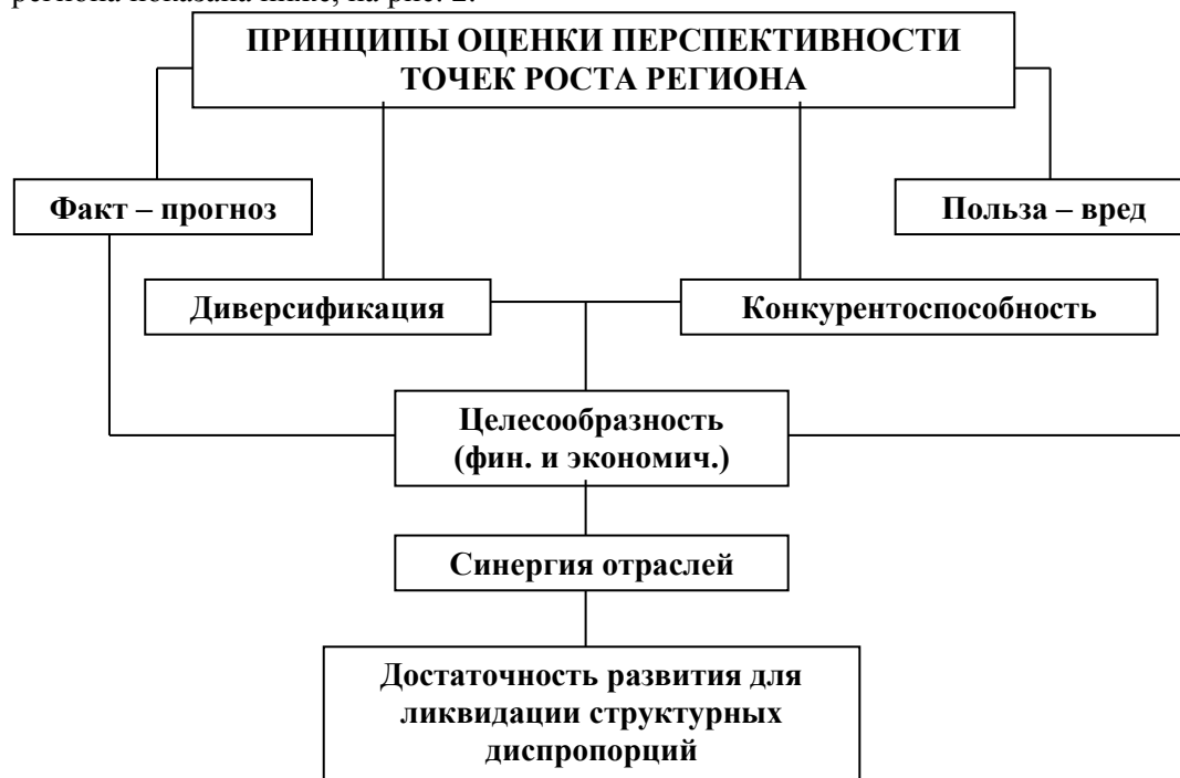
Рис. 2. Систематизация принципов оценки перспективности точек роста региона

Системная взаимосвязь принципов оценки перспективности точек роста региона показана ниже, на рис. 2.