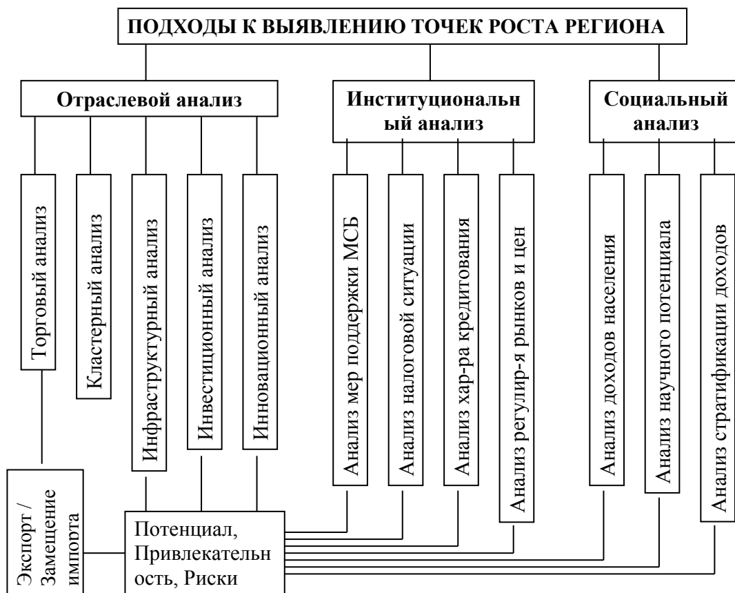
Рис. 1. Систематизация подходов к выявлению точек роста региона

Системная взаимосвязь подходов к выявлению точек роста региона показана ниже, на рис.1.