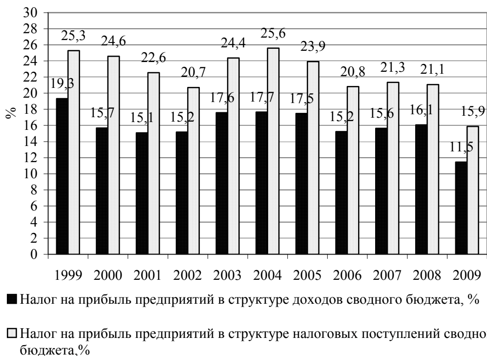
Рис. 3. Доля налога на прибыль предприятий в структуре доходов и налоговых поступлений сводного бюджета в 1999-2009 гг. (%)

Доля налога на прибыль предприятий в структуре доходов и налоговых поступлений сводного бюджета представлена на рисунке 3.