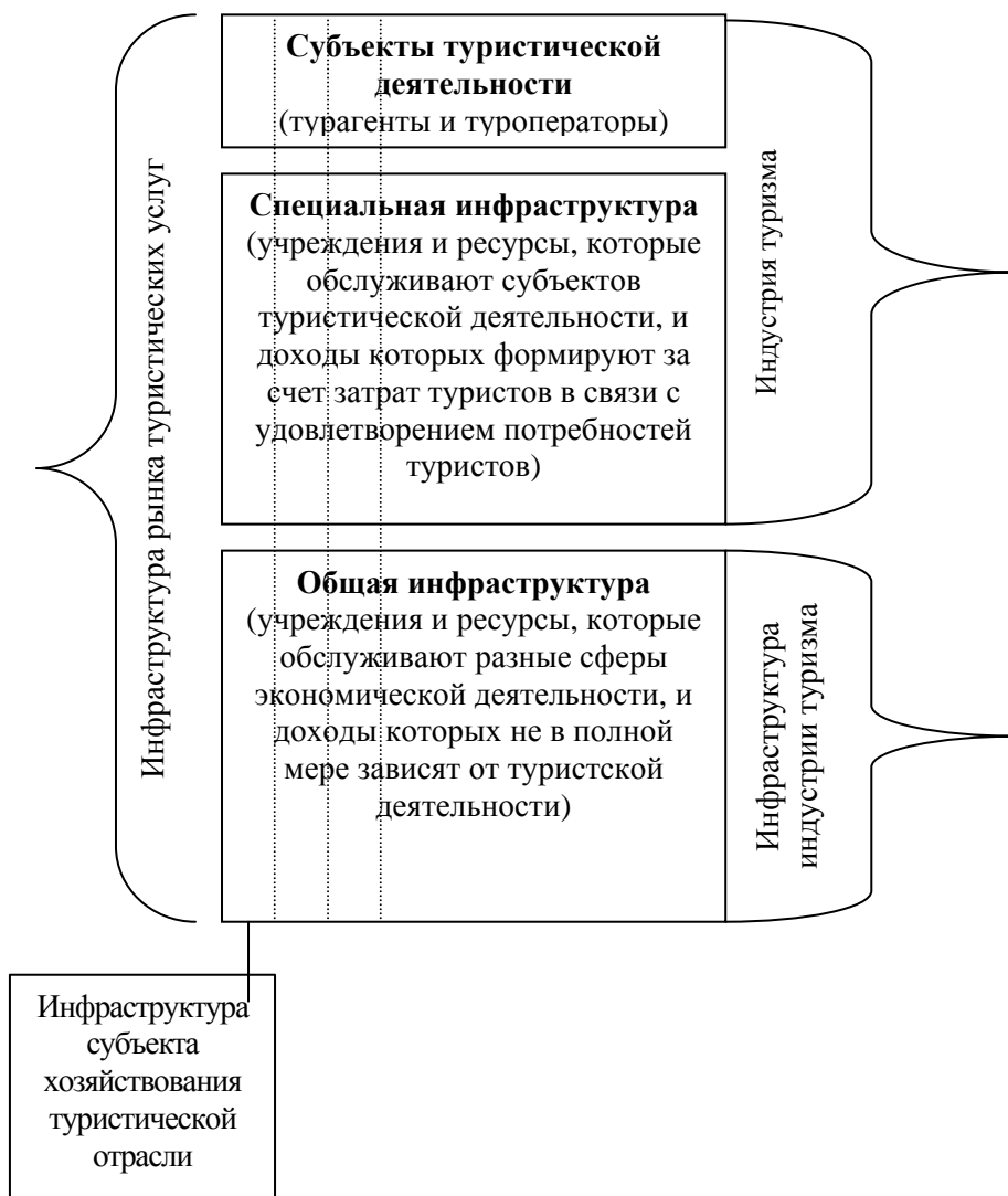
Рис. 1. Модель инфраструктуры рынка туристических услуг

Инфраструктуру туризма можно представить в виде следующей модели (рис. 1).