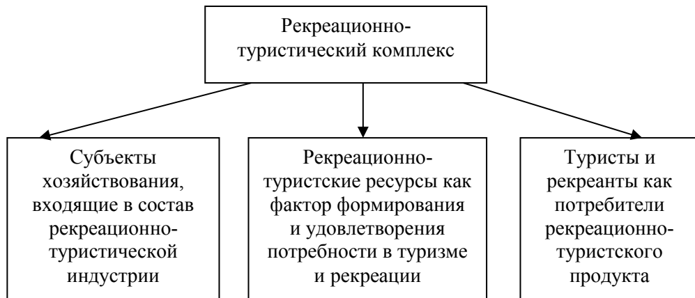
Рис. 1. Структура рекреационно-туристического комплекса.

Структура рекреационного комплекса представлена субъектами рекреационно-туристической индустрии, ресурсами и потребителями (рисунок 1). При этом рекреационно-туристический комплекс постоянно подвержен изменениям, что требует выявления динамики развития рекреационно-туристических услуг на территории РК. Так, в 2014 г. количество рекреантов, прибывших на отдых и лечение, составило 196,3 тыс. чел., что на 11,4 % больше, чем в предыдущем году. В структуре объема реализации туруслуг наибольший процент занял внутренний туризм – 71 %, на втором месте – иностранный – 28,6 %. При этом большая часть отдыхающих прибыла на полуостров авиатранспортом – 2 млн 998 тыс. человек – и железнодорожным транспортом – почти 620 тыс. человек.