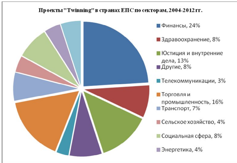
Рис. 1. Проекты «Twinning» в странах ЕПС по секторам, 2004-2012 гг. Составлено автором на основе [1].