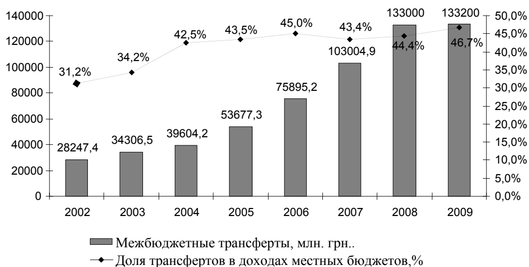
Рис. 1. Динамика межбюджетных трансфертов местным бюджетам

Таким образом, в современных условиях трансферты занимают важное место в межбюджетных отношениях; вместе с введением в действие Бюджетного кодекса они стали основным методом бюджетного регулирования.