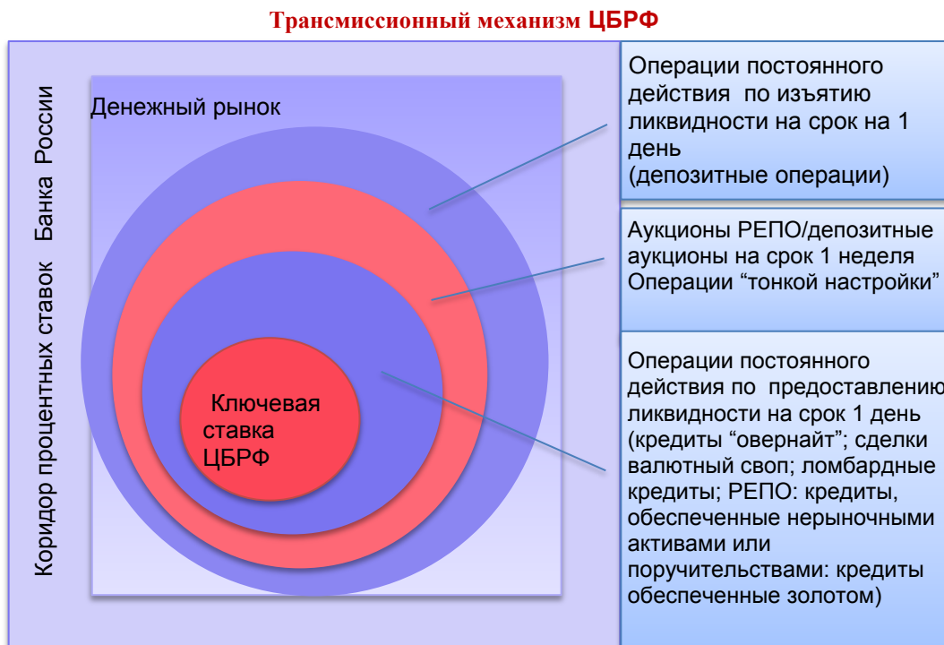
Рис. 1. Трансмиссионный механизм ЦБ РФ