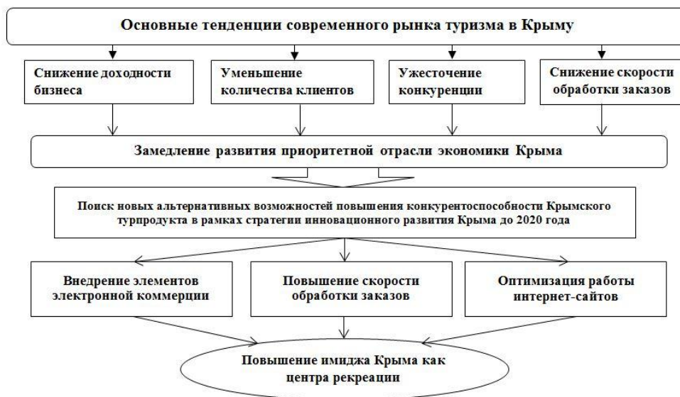
Рис. 1. Основные тенденции развития рынка туристских услуг АР Крым

В процессе анализа внедрения системы инструментов Интернет-маркетинга в деятельности туристских фирм АР Крым были определены важнейшие критерии, которые оказывают влияние на оценку веб-сайтов пользователями сети и потенциальными потребителями турпродукт, определяющим среди которых стали: простота и краткость URL, время загрузки странички, первое впечатление, необходимость установки дополнительного программного обеспечения, наличие главной странички на одном экране, удобство навигации, интерактивность (чат, форум), информативность и актуальность контента, контактная информация, история фирмы, авторитетность (информация о лицензиях, сертификаты, дипломы), сервис онлайн-бронирования, наличие мобильной версии сайта. На рис. 1 представлены ключевые особенности современной конъюнктуры рынка туристских услуг в Крыму, а также возможности выхода из сложившейся ситуации с помощью внедрения элементов электронной коммерции и оптимизации электронных ресурсов субъектов рынка.