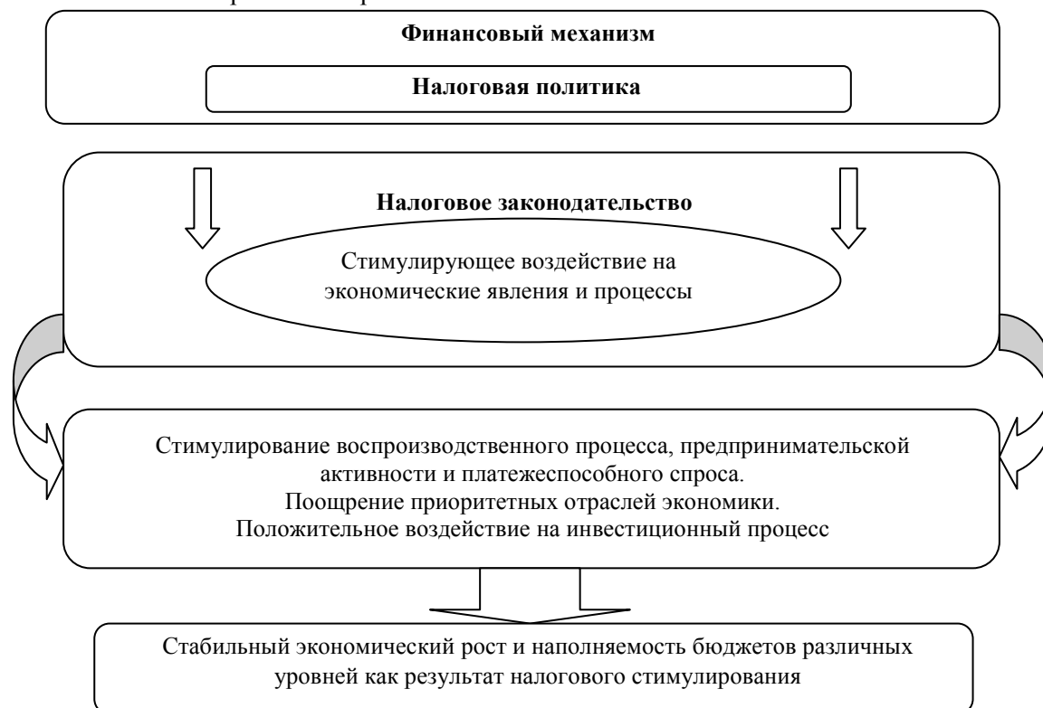
Рис. 2. Механизм налогового стимулирования как процесс реализации экономической функции налога.

Официальная статистическая информация не дает величину недополучения налогов в бюджет государства в результате использования налоговых льгот. В связи с этим оценить количество и качество стимулирующих элементов достаточно сложно. Поэтому реализовать экономическую функцию налога можно только с помощью применения налогового стимулирования, которое будет использовать все разработанные государством инструменты налоговой политики для реализации экономического развития страны.