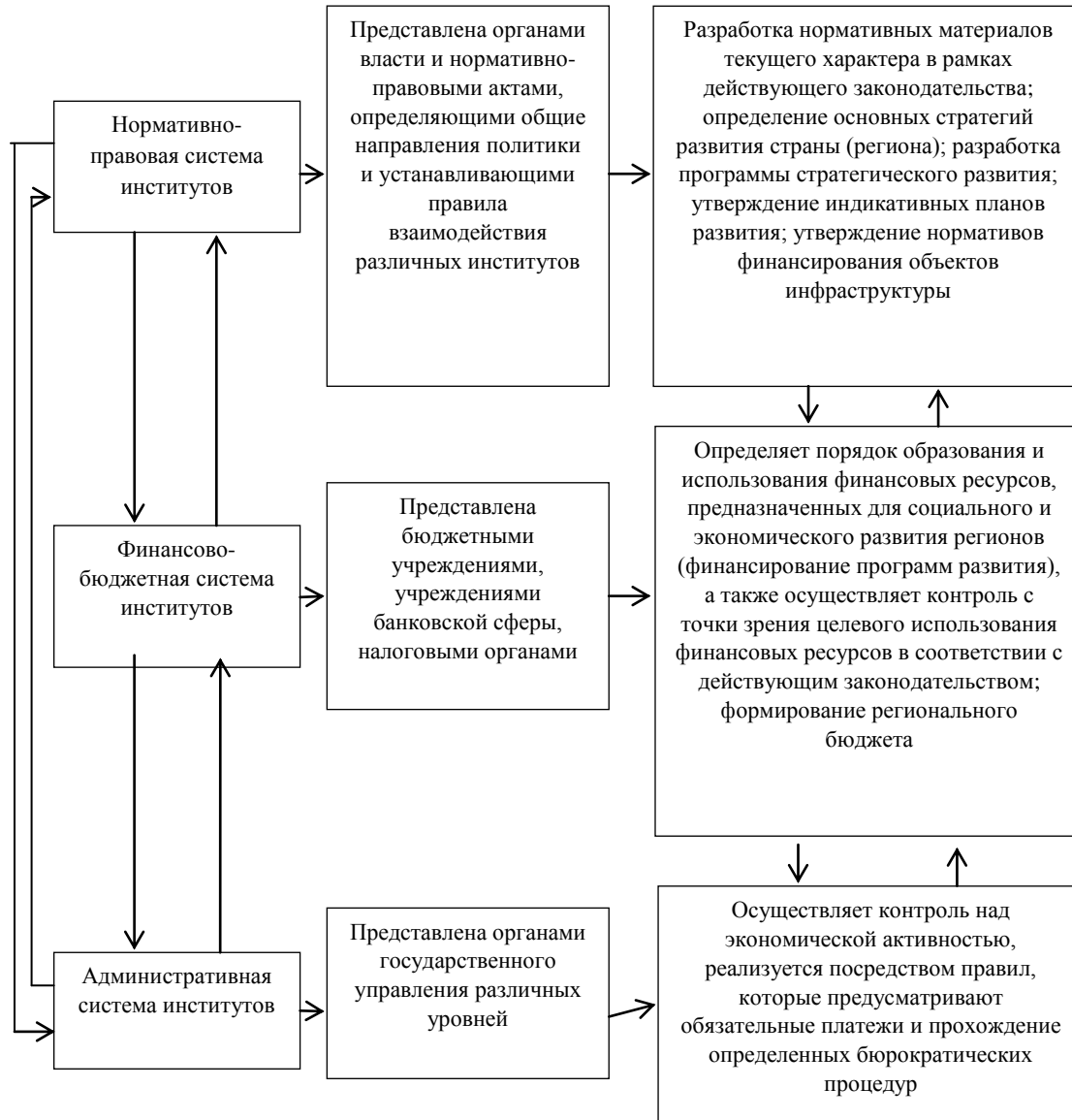
Рис. 1. Взаимосвязь системы институтов регионального развития при реализации целевых программ.

При реализации целевых программ регионального развития можно выделить следующие системы институтов (рис. 1).