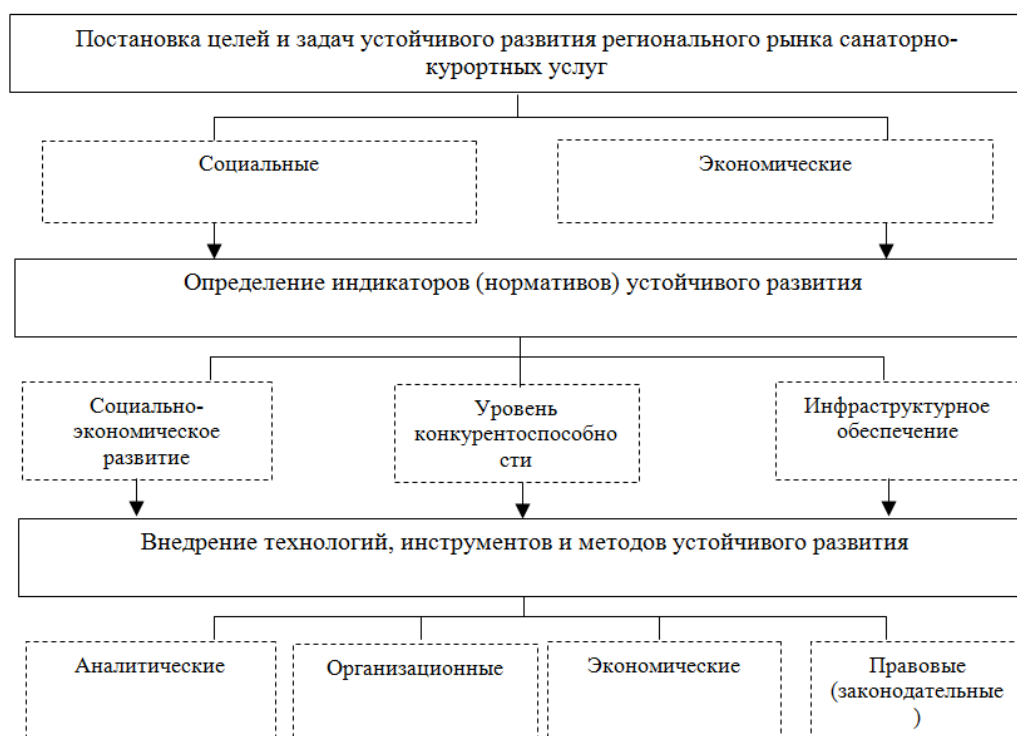
Рис. 1. Система устойчивого развития рынка санаторно-курортных услуг.

Как видно, стратегический механизм управления устойчивым развитием территориального рынка санаторно-курортных услуг представляет собой взаимосвязанную совокупность мероприятий, направленных на обеспечение поступательного, сбалансированного и равновесного развития региональных рынков санаторно-курортных услуг. В основе функционирования предложенного механизма должны лежать принципы, позволяющие, во-первых, учитывать особенности устройства санаторно-курортной индустрии; а, во-вторых, решать и упреждать проблемы, которые ограничивают полноценную реализацию потенциала роста территориальных санаторно-курортных систем.