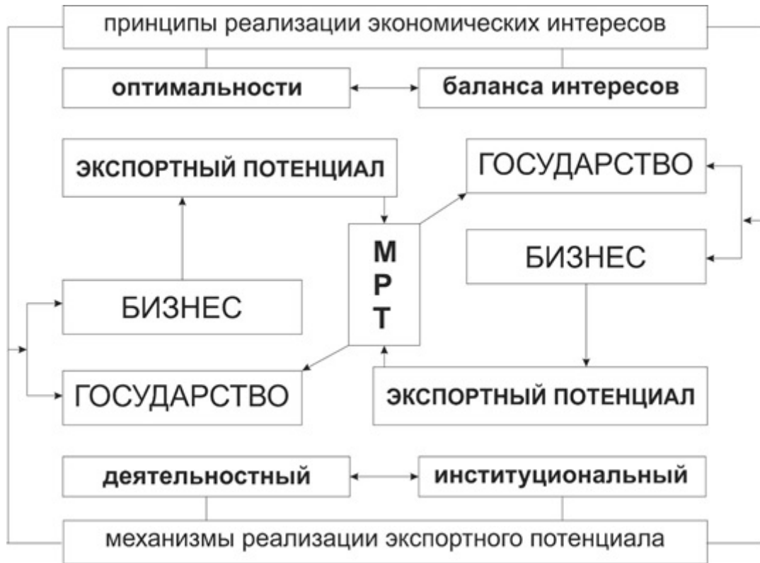
Рисунок 1. Графическое отображение понимания экспортного потенциала

Особенно эти проблемы проявляются, когда стратегию развития агентов ВЭД необходимо увязать со стратегией развития экономики государства, основанной на реализации экспортного потенциала, т. е. когда развитие бизнеса и социально-экономическое развитие страны должны учитывать в своем функционировании экспортную составляющую. А вместе с этим учитывать точно такие же интересы со стороны иностранных экономических агентов и их государственных институтов.