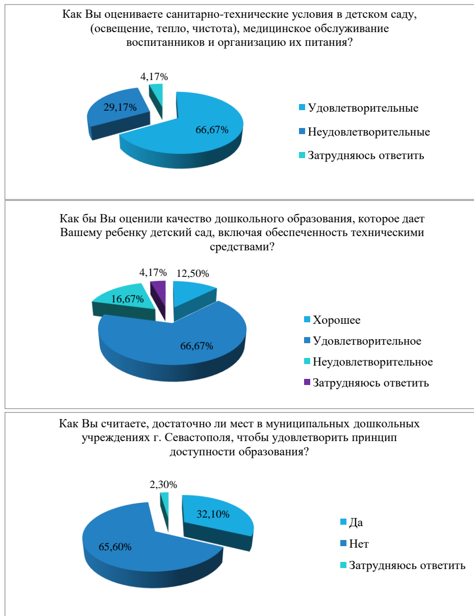
Рис. 1. Результаты опроса респондентов г. Севастополя о качестве дошкольного образования

В рамках исследования проблемы авторами было произведено анкетирование жителей г. Севастополя, имеющих детей дошкольного возраста. Результаты опроса представлены на рисунках 1 и 2.