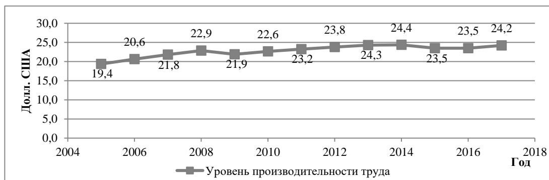
Рис. 2. Динамика уровня производительности труда в Российской Федерации, 2004–2017 гг., долл. США