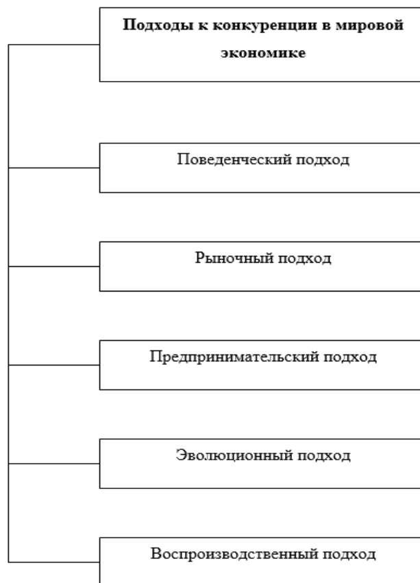
Рисунок 1. Методологические подходы к конкуренции в глобальной мировой экономике [1, 5]

На основе вышеприведенного рисунка можно отметить, что в мировой науке выделяют пять ключевых подходов к раскрытию сущности конкуренции в условиях глобализации мирохозяйственных связей: