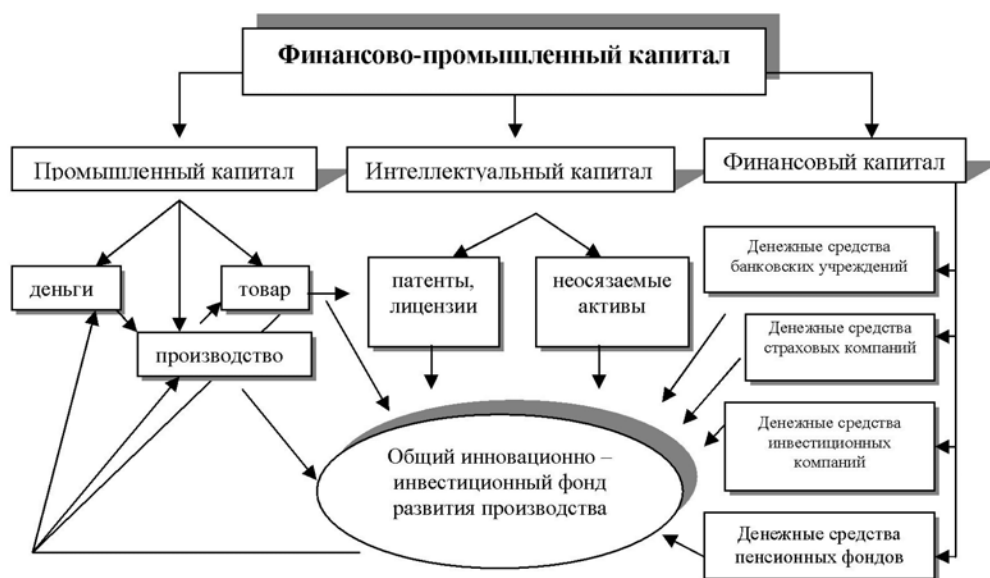
Рис.1. Финансово-промышленный капитал в системе ИКС

Финансово-промышленный капитал представляет не только важнейший и мощный инвестиционный ресурс, но и определенную структуру взаимодействия, посредством которого наиболее эффективно осуществляется процесс консолидации и распределения инвестиций. Взаимодействие финансово-промышленного капитала в системе ИКС изображено на рис. 1.