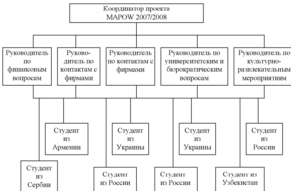
Рис. 3. Структура управления проектом МАРОВА 2007/2008

получение прибыли. Для мотивации приглашенных студентов проект выплачивает студентам стипендию, сумма которой полностью находится в личном распоряжении стипендиатов.