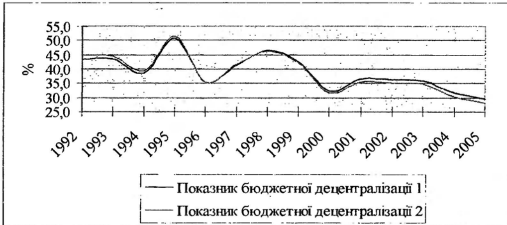
Рис 1. Рівень бюджетної децентралізації в Україні в 1992-2005 рр.

Динаміку обох коефіцієнтів фіскальної децентралізації відображено на рисунку 1.