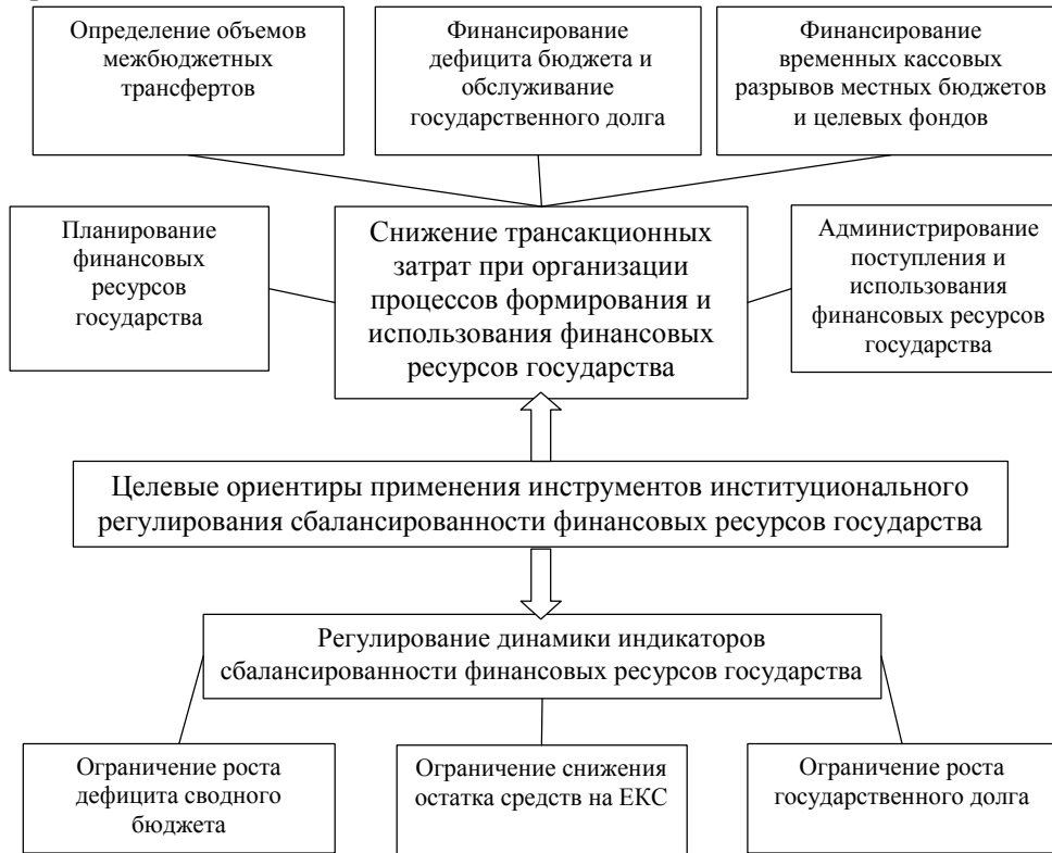
Рис. 2. Целевые ориентиры институционального регулирования сбалансированности финансовых ресурсов государства

Также отличаются и транзакционные издержки изменения вышеупомянутых институциональных правил. А значит, целесообразно ранжировать совокупность институциональных инструментов регулирования сбалансированности финансовых ресурсов государства, с точки зрения их приоритетности и значимости в целях регулирования.