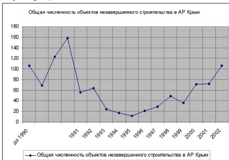
Рис. 2. Количество объектов незавершенного строительства сгруппированных по годам остановки работ над объектом в АР Крым [7]

Динамику изменения количества ОНС начиная с 1990 можно проследить на диаграмме (рис.2)