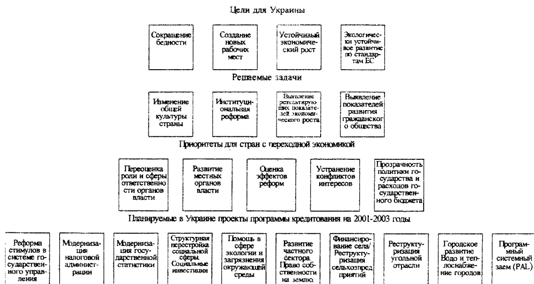
Рис. 1. Поле деятельности Всемирного банка в Украине