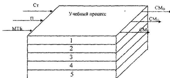
Рис.3. Компоненты научно-методического обеспечения учебного процесса

Своеобразным «фундаментом» для эффективного осуществления педагогического процесса профессиональной подготовки специалистов-менеджеров служит научно-методическое обеспечение учебного процесса (Рис.3). Это обеспечение является динамичным и находится в постоянном развитии в связи с необходимостью удовлетворения меняющихся потребностей общества к профессиональным качествам специалистов-менеджеров. Научно-методическое обеспечение учебного процесса включает в себя совокупность документов, наличие которых обеспечивает эффективное функционирование системы.