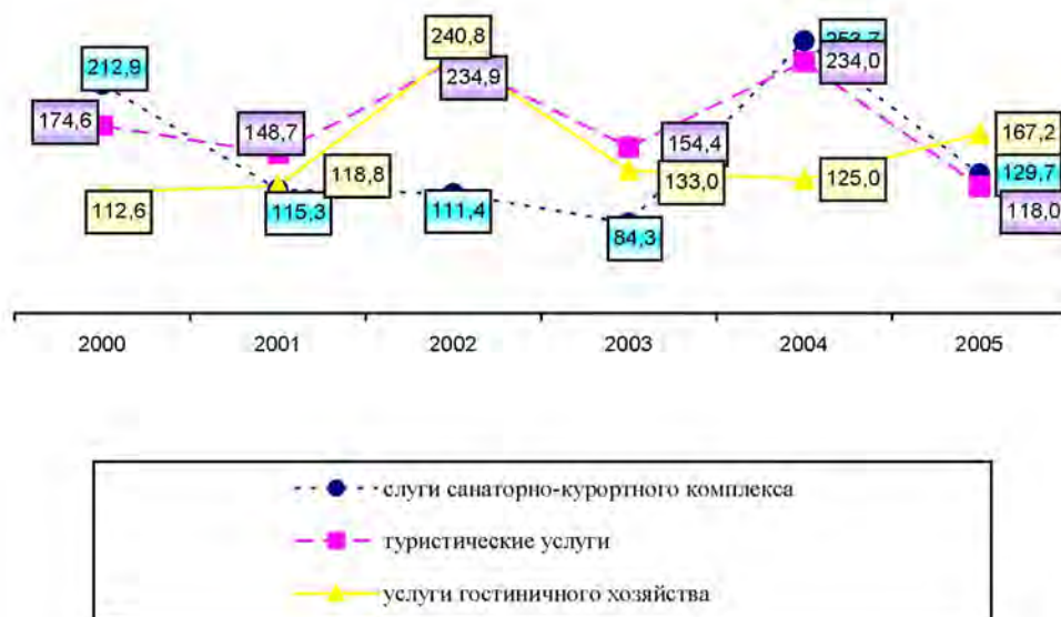
Рис.1. Динамика темпов роста экспорта рекреационных услуг, % от предыдущего года

отказ российских и иных туроператоров от заездов, согласно ранее заключенных договоров (рис. 1). Поэтому следующий год был нацелен на преодоление потерь и восстановление численности иностранных рекреантов.