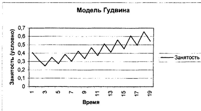
Рис. 2. Динамика колебаний занятости в модели Гудвина.

Многие экономисты считают [7, 8], что нарушения и неравномерности в системе распределения приводят к выраженным колебаниям в деловой активности.