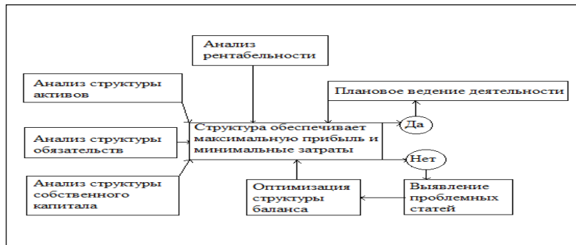
Рисунок 1 Механизм повышения эффективной деятельности коммерческого банка