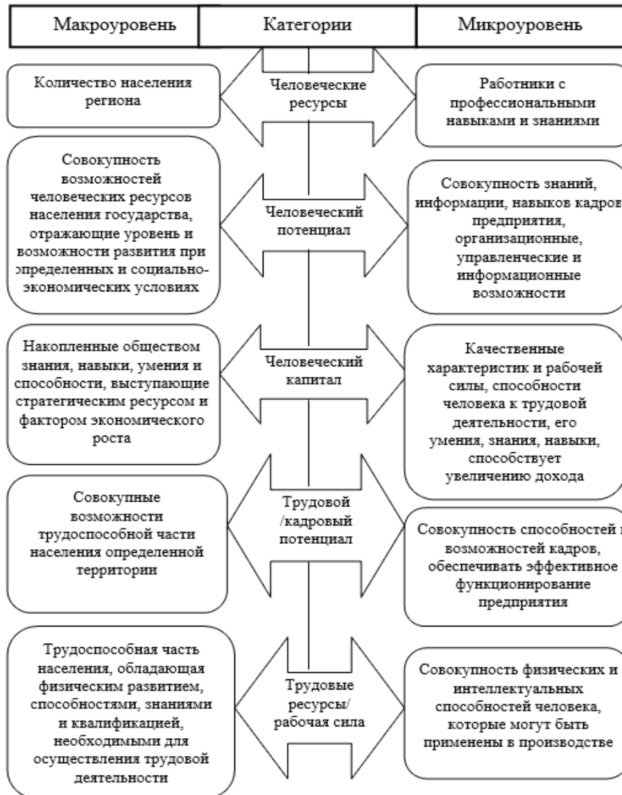
Рисунок 3. Содержание трудовых категорий на макро- и микроуровне.

Считаем целесообразным рассмотреть дифференциацию основных трудовых категорий в разрезе макро- и микроуровней в зависимости от степени формирования человеческого капитала (рис. 3).