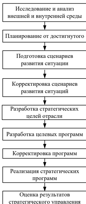
Рисунок 1. Модель стратегического менеджмента нефтегазовой отрасли

Предложенная выше модель стратегического менеджмента является основной для нефтегазовой отрасли и позволяет соблюдать режим устойчивого развития.